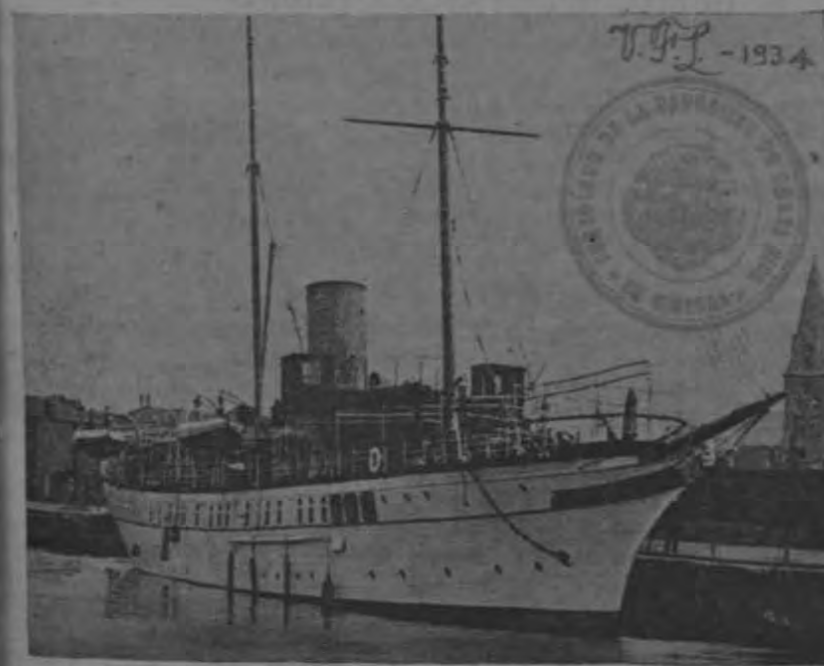
LA PRENSA LIBRE publicó hace algunos años las Memorias de uno de los miembros de la Expedición Lake Clayton, que exploró la Isla del Coco